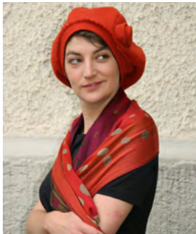
G. Hunger, Kopfbedeckung