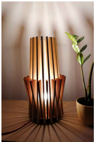
Erwin Haushofer, Lichtobjekt